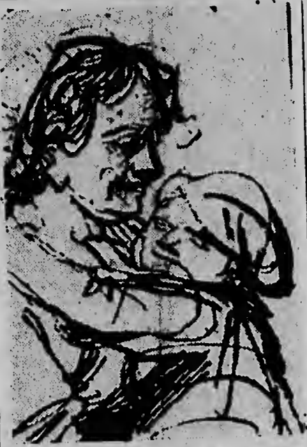
Fragment van "Rembrandt's 'Vrouw met kind op de arm'". Een reproductie van deze tekening, die in het Rembrandthuis te Amsterdam thuis hoort, is deze week te bezichtigen in Trocadero.